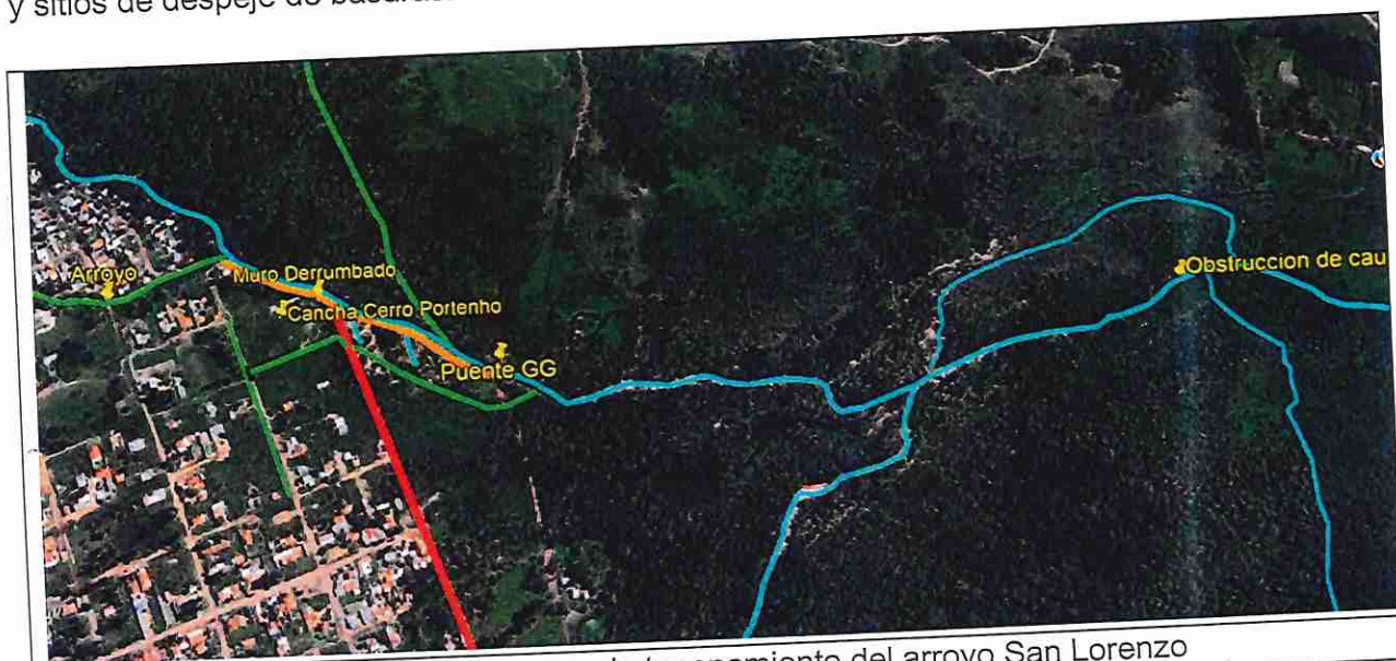
Figura 1: Tramo ultimo urbano y zona de taponamiento del arroyo San Lorenzo

El proceso de colmatación se viene produciendo en el predio particular de la empresa Gonzáles Giménez, que no puede ser evitado por los propietarios, ya que los detritos arrastrados provienen de la cuenca de aguas arriba donde el arroyo transita por zonas densamente pobladas y sitios de despeje de basuras.