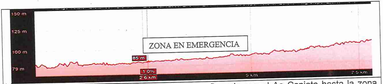
Figura 2. Perfil del Ao San Lorenzo desde la confluencia con el Ao Capiata hasta la zona urbana central de San Lorenzo. El tramo en emergencia sería de unos 2 km.